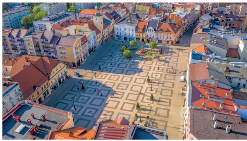
Rynek miejski w Rybniku, fot. M. Giba, Krajna Górnej Odry

RYBNIK – największe miasto Krajny Górnej Odry, powstałe w miejscu dawnej osady rybackiej, której miasto zawdzięcza swoją nazwę oraz herb.